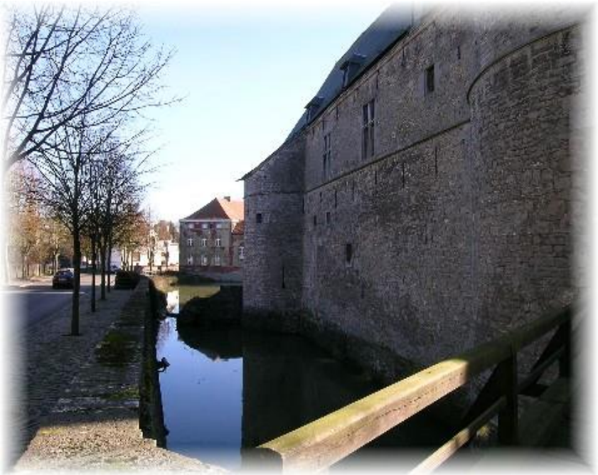
Het kasteel van Feluy zoals dat er nu bij staat.

Feluy was een mooi historisch dorp met veel oude gebouwen. Er woonde een paar honderd mensen. Midden in het dorp lag een groot kasteel uit de 14 de eeuw met een slotgracht. We liepen er eerst