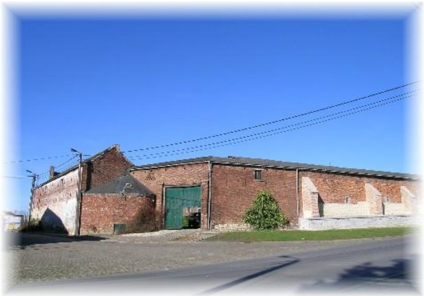
De versterkte boerderij in Buzet.